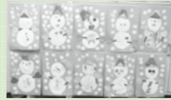
3歳児「もも組」の作品

〒948-0011 十日町市新座甲823-4 TEL (025) 757-6002 FAX (025) 757-6002