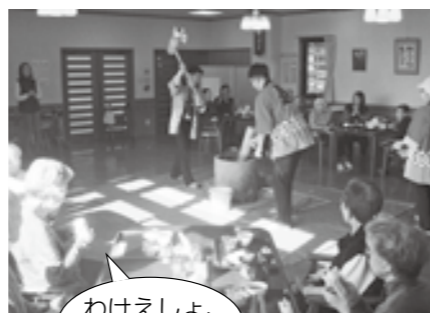
わけえしよ、頑張っ！

的に行っています。ただ黙々と取り組んでいるわけではありませぬ。昔の思い出から最近のニュース、スポーツの話題等