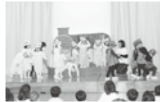
3歳児もも組「3びきのこぶた」

子ども達は少し緊張した様子の中にも、お家の方に見てもらえる嬉しさを感じていました。温かい拍手ありがとうございました。