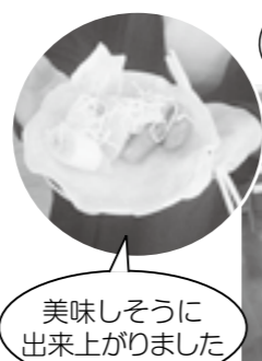
美味しそうに出来上がりました