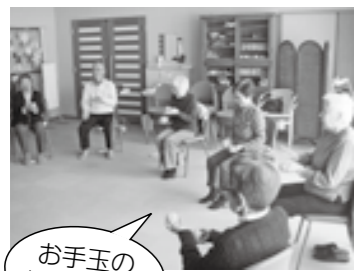
お手玉の体操中です

〒949-8603 十日町市下条3丁目496 TEL(025)750-3344(代表) FAX(025)756-2113