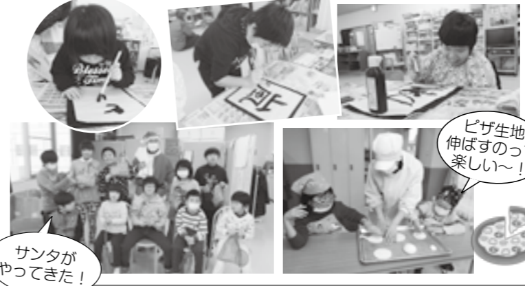
ピザ生地伸ばすのって楽しい~! サンタがやってきた!

障害福祉全体の目標になっていることは、「共生社会の実現」にあります。これは障害がない人もある人も、すべての人が一緒に暮らせるまじゅうたくりをしようということです。 アメリカの大統領選挙でよく見聞きしたのが、「ダイバーシティ(多様性)」という言葉でした。世の中には、いろいろな人種や信条の違う人が一緒に暮らしています。 自分の価値観だけではなく、いろいろな人のことを認めることの大切さを訴えています。 自分の価値観と違う人のことを排除しようとすれば、いじめにつながったり、社会に出ればパワハラに通じたりします。 放課後等デイサービスでは、常に児童や社会が多様であることを意識した中での支援に心がけて、子ども達が社会に出たときに共生社会をつくる一員になれるよう願っています。 年末年始の冬休みも通常利用以外の子ども達も受け入れて、調理、おやつ作り、書初