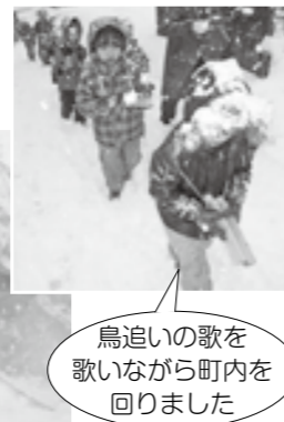
鳥追いの歌を歌いながら町内を回りました