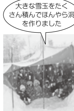
大きな雪玉をたくさん積んでほんやら洞を作りました