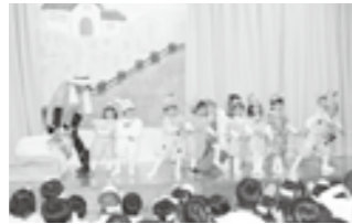
2歳児ちゅうりっぷ組「おおきなかぶ」