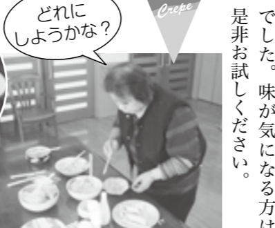
どれにしようかな？