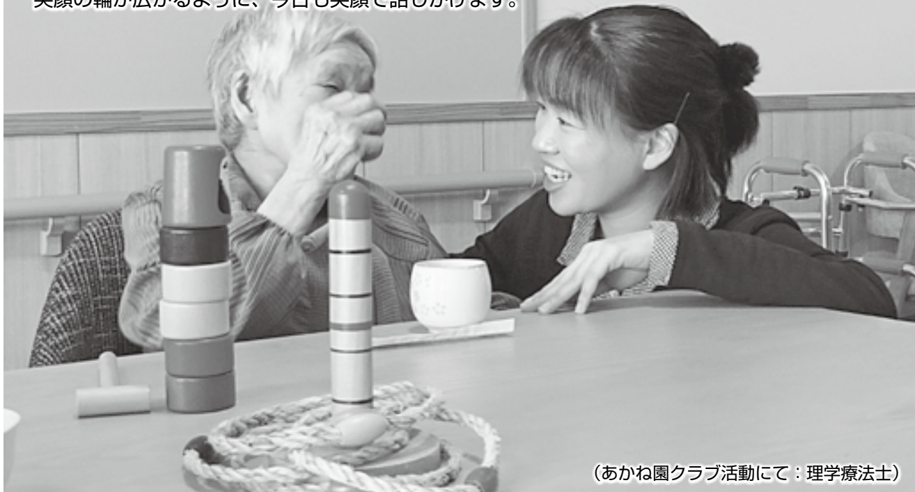
（あかね園クラブ活動にて：理学療法士）

毎日の小さな「できた」と「笑顔」の積み重ねを大切にしています。 笑顔の輪が広がるように、今日も笑顔で話しかけます。