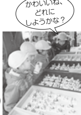
かわいいね、どれにしようかな？