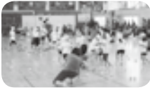
どっちが沢山入るかな？