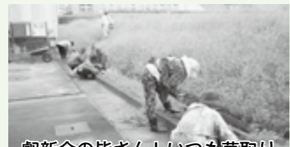
観新会の皆さん！いつも草取り等、ありがとうございます！

通所介護にて、職員の言動についてご意見を頂きました。お詫びし、対人における基本マナーの徹底に努めてまいります。貴重なご意見ありがとうございました。