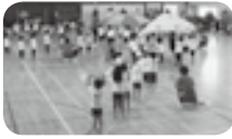
遊戯【フラワー】パルーンの花が咲きましたよ。