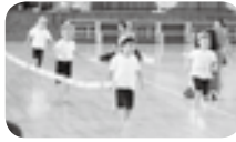
かけっこ、速い・速い！

り3・4・5歳児のなかよしグループで5色に分かれてきれいな花を咲かせました。隊形の移動もあり2列になってのライダンス！そして最後に大きなパルーンの大輪がきれいに咲き大きな拍手をもらい子ども達はとても嬉しそうでした。台風が来ていることもあり、東小学校の体育館で行いましたが、雨や風を吹き飛ばす程に盛り上がった運動会でした。