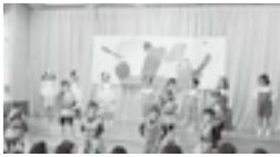
すみれ組(4歳児) 「ヒーローマンとかぜひきキン」