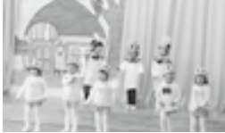
もも組(3歳児) 「おしゃれなおたまじゃくし」

12月7日(土)、日ごろの活動を発表する「おたのしみ会」が行われました。オーブニングは3、4、5歳児の元気な歌声で『ちいさなせかい』を歌いました。そして楽器や太鼓の演奏、踊りを披露したり、オペレッタや劇では役になりきり元気に演じました。大勢のお家の皆さんに来ていただき、あたたかい声援とたくさんの方の拍手に包まれて子ども達も楽しく発表が出来ました。自信を持ってステージに上がる子ども達の姿に成長を感じたおたのしみ会でした。