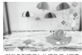
就労B型事業と放課後デイ児童のコラボ作品のカタツムリです

廃電線の中には、ワイヤーアートとして活用出来る物があります。ご連絡下されば材料の提供もできますので是非、夏休みの工作にいかがでしょうか。